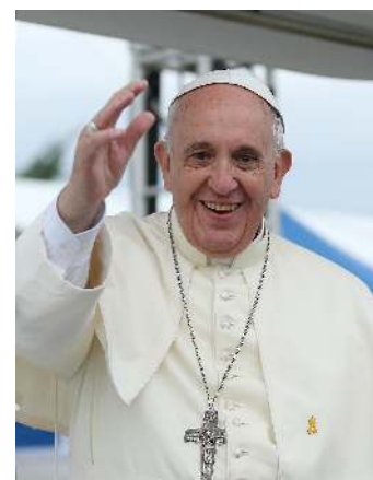
Aplikacja do modlitwy